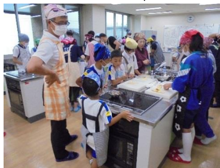
みんなをうまくリードしながら...