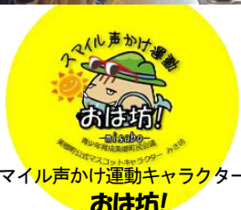
スマイル声かけ運動キャラクター

終業式の日まで、毎朝「あいさつ運動」をしていただいています。「邑智の子どもはあいさつ上手」と言われる日もそう遠くなくさそうです。