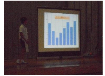
あいさつニュース