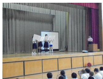
あいさつ言葉発表