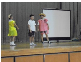
あいさつニュース