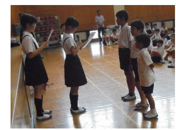
あいさつ運動表彰