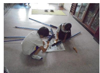
自在ぼうきの毛先まで