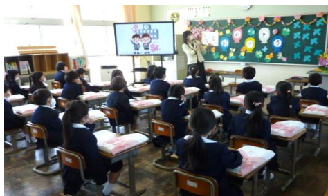
教室では担任から学校生活について話をききました。