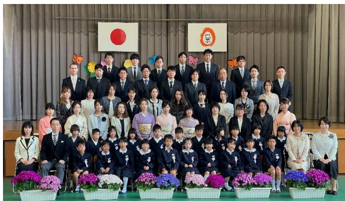
学校生活に早く慣れ、元気いっぱい学習したり、遊んだりしてくれることを願っています。