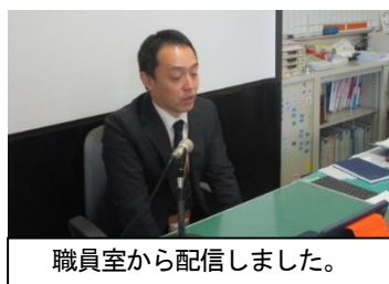
職員室から配信しました。