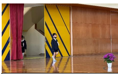
一人一人間隔をあけて、入場しました。緊張気味ながらも堂々と入場しました。