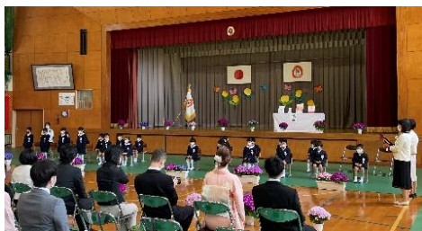
名前を呼ばれると、「はい」とおおきな声で返事ができました。

九日(金)新型コロナウイルス感染拡大防止対応の上で入学式を行いました。来賓の皆様には、参加者縮小のため、ご出席を見合わせていただくこととなり、誠に申し訳なく思います。新入生21名の新生活を祝う心のこもった式典となりました。