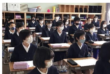
子ども達は、各教室で映像を見ながら静かに話を聞いています。

子ども達は各学級で真剣に話を聞いてくれました。今年度も力をあわせて、「二人一人が輝き、笑顔あふれる邑智小学校」をつくっていこうと思います。保護者の皆様・地域の皆様、一年間邑智小学校をよろしく願います。