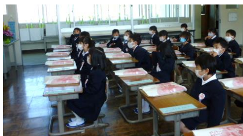
手を机の下において、先生の方をしっかりと見て、話を聞くことができました。